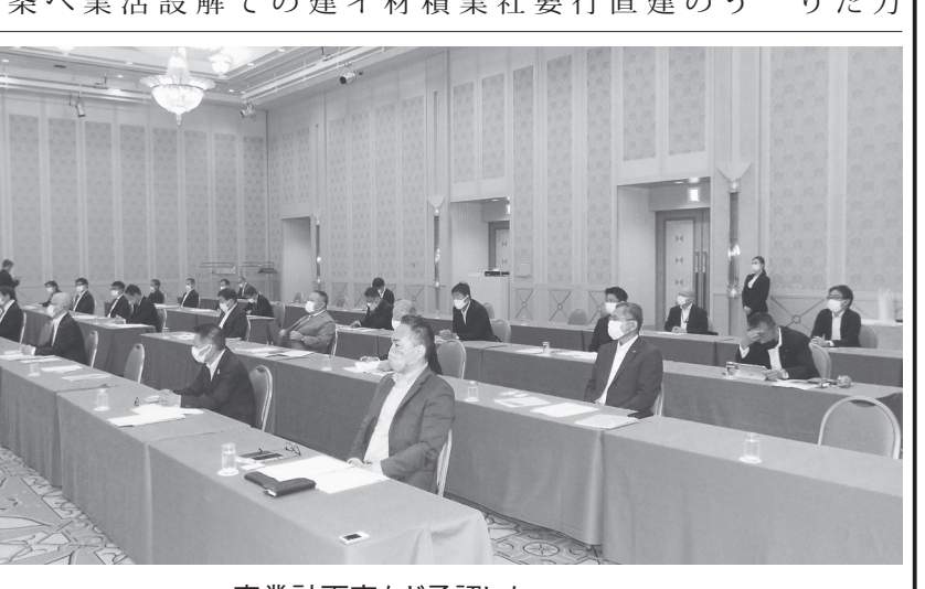
事業計画案など承認した