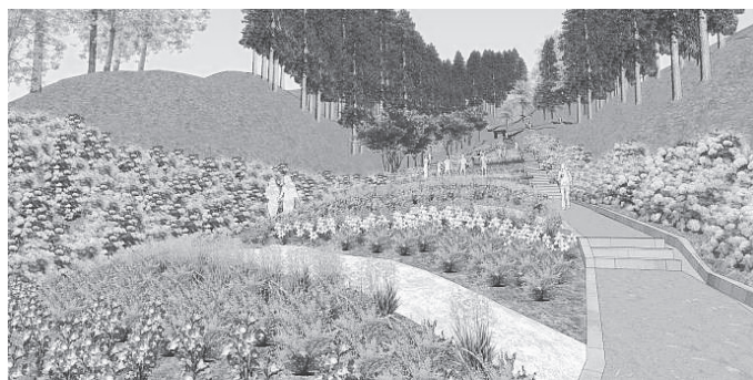
中腹部周辺イメージ

同事務所は、エントランス部分から園路、階段などを修復及び新たに整備し、成長しすぎたあじさいをはじめとする植栽を植え直すと共に、新たに四季を感じられる様な形で他の植物なども植えていく方向で考えており、