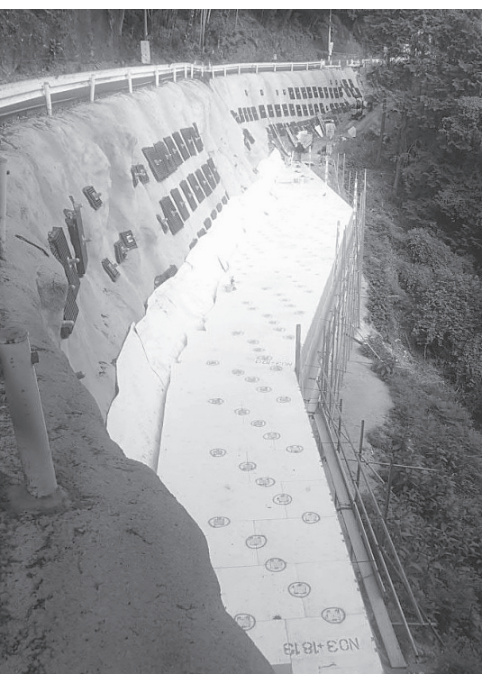
軽量盛土工が行われている

奈良県五條土木事務所が推進している阪本五條線の道路改良事業は、現在、五條市大深町で拡幅のための擁壁工事を行っている。阪本五條線は、五條市大塔町阪本から和歌山県の高野町を経て、