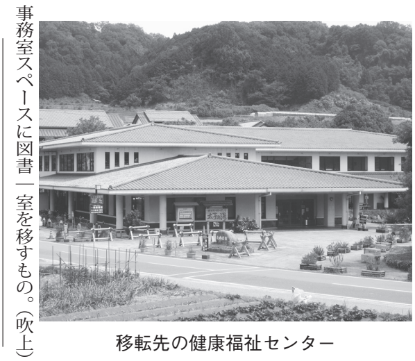
移転先の健康福祉センター