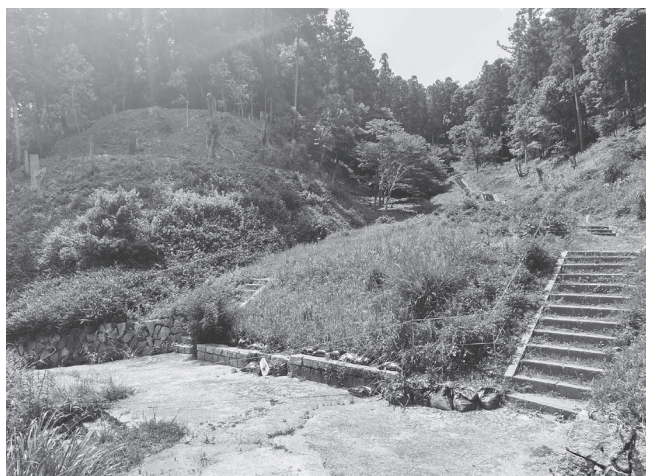
エントランス部分の着工が待たれる「あじさい園」