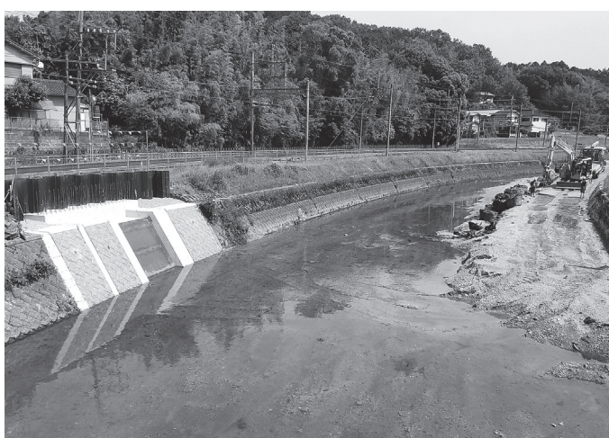
再開は出水期の終わる11月