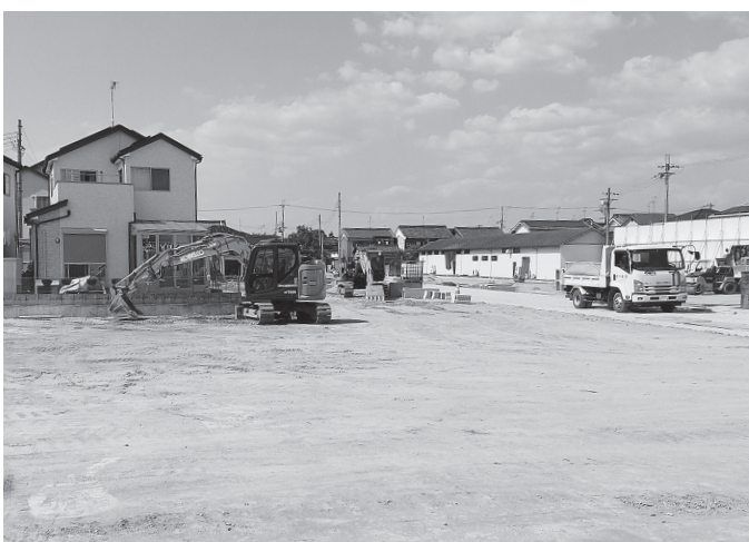
町道の整備と宅地造成を進めている

広陵町と広陵町土地開発公社は、箸尾準工業地域工場用地造成事業「代替地造成事業」を推進している。同事業は、今年度の着工に向け準備を進め