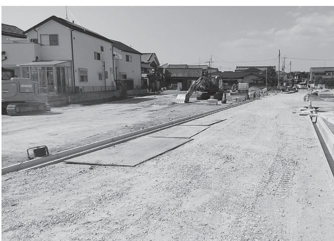
箸尾準工業地域工場用地造成事業の関連事業

せる等プレゼンテーションや完成した建物を魅力的に見せるエンターテイメント等です。今年2月に着手し、施工は道路の整備を中山組、宅地の開発を山崎産業が担当。工事は天候にも恵まれて順調に進んでおり、5月24日時点で進捗率は約70%。事業全体は7月末の完成を目指している。同町は、「箸尾準工業地域工場用地造成事業」を進めるべく、道路整備などの発注準備を進め、今年度から本格的に「箸尾準工業地域」の整備を進めていく予定だ。