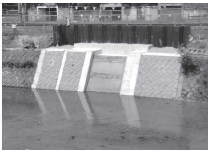
護岸部分の工事はほぼ完成している

の資材調達が遅れており、また、出水期を迎えるため、現時点で工事を一時休止し、11月から再開する予定。工事概要は、下部工事、工事延長30m、護岸工(左岸側)25平方m、井堰下部工、操作室建