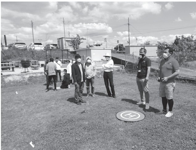
ドローン操作の指導を受ける参加者

ドローン業界と建築に活かす可能性、今後の法改正等の情報を共有し合った。当日は、ドローンスクールWUCA(ウーカ・東大阪市今米)指導の下、ドローン操縦