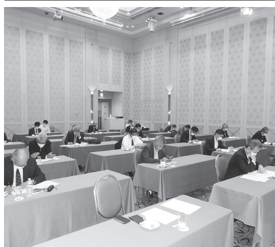
コロナ感染対策を講じて総会を開催

【業務報酬基準(国土交通省告示第98号・第670号)の普及徹底要運動の実施 【教育・情報委員会】 ▽会員向け情報提供 ▽建築士事務所のデータベースの構築 【広報・渉外委員会】 ▽会報誌「やまと」 ▽会名簿及び「入会案内」等の編集発行 ▽会内等の編集発行、会員及び関係先への配布 ▽建築設計監理業務の進歩改善と建築士事務所との健全な発展を図るための関係機関への要望、陳情の実施