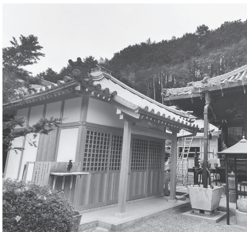
建て替えられた荒神堂と、屋根替え・改修を待つ本堂