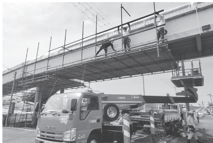
足場の組み立て作業が進んでいる

上高が低くなる分、告知や注意喚起を徹底して行い、夜間の視認性も確保し、接触事故などが起こらないよう細心の注意を払いながら作業を進めるとしている。工事の概要は、工事延長1577m、橋梁塗装工2640平方m、ひびわれ補修工1・3m、断面修復工0・011立方m、目地補修工54m。設計は修成建設コンサルタントが、施工を福嶋組が担当する。若干天候等の影響を受けてはいるが、同事務所は9月末の完成を目標し、工事を推進している。