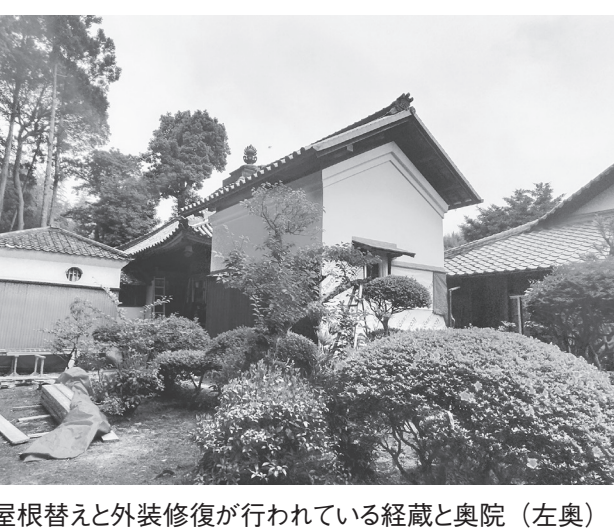
屋根替えと外装修復が行われている経蔵と奥院(左奥)

てゆく。伽藍の整備は、秘仏の虚空蔵菩薩が安置されている奥院の土蔵造から堂造りへの建て替、本堂の屋根替え及び改修、山門の立て替えなど、順次行っていく予定で、当初令和5年末完成を目指していたが、先述のコロナウイルス感染症の影響