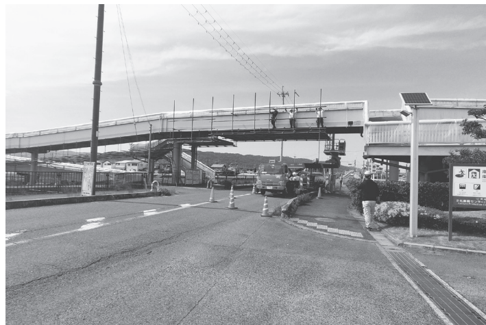
交通量の多い幹線をまたぐ作業となるため細心の注意が求められる