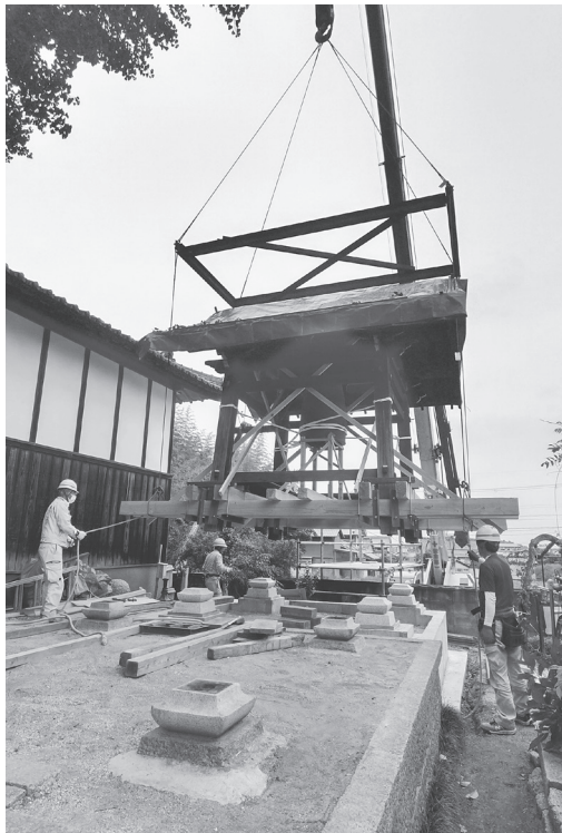
鐘楼の移設が行われた