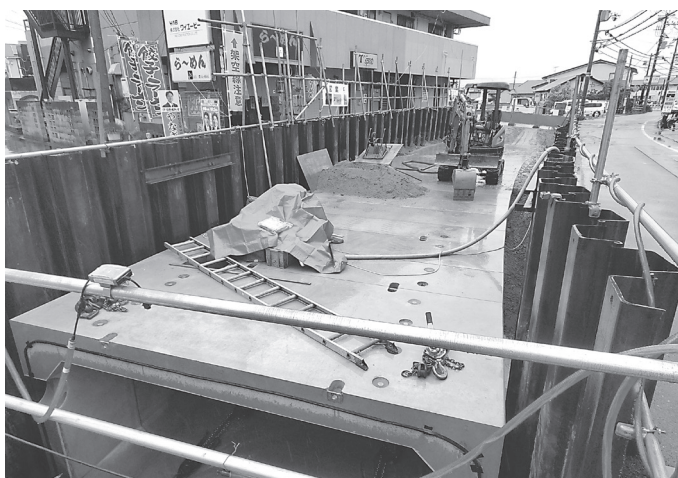
埋め込まれたボックスカルパート

所で、乾川を函渠とし、その上に市道を拡幅整備する工事を行っている。 工事延長49・1メートル、設計は函渠工46・5メートル。設計はサンコーコンサルタント、施工は奈良県緑