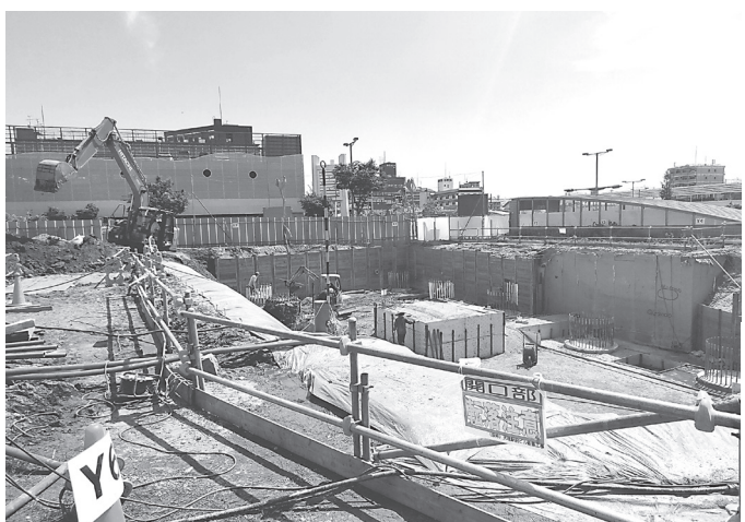
基礎配筋の準備が進む

天理教西駐車場の内、南半分にあたる、1791・95平方メートルの敷地を天理時報社が天理教本部より賃借したもので、鉄筋コンクリート造14階建、建築面積372・16平方メートル、延床面積約4038・13平方メートル、高さ45・60メートル。国内外でホテルチェーンを展開する東横イン(東京都)が、県内4番目となるホテル、県内最多の218室が入る店舗「(仮称)東横イン天理駅前」として開業する予定。 同ホテルの建設は、印刷会社である天理時報社が、経営の多角化の一つとして企画され、駅前の土地の有効活用と、経済的な沈下