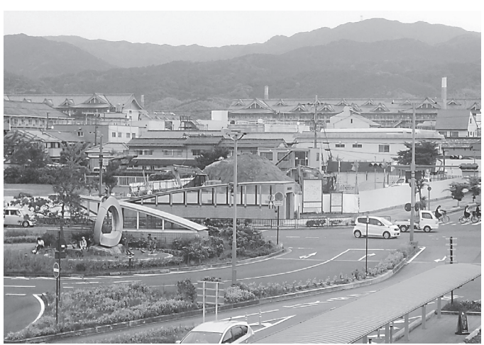
駅前という好立地に地域活性化への期待も

県が担当し、現在、順調に施工を進めている。5月18日時点では、掘削、打杭を終えた段階で、基礎配筋に入る準備を進めている。駅前の活性化への期待を寄せている。 体の施工は東横イン電建が担当し、来年の秋に完成を予定している。ホテルの開業に、天理市も地域活性化への期待を寄せている。