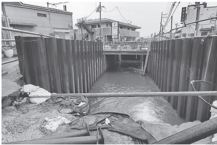
河川と道路の拡幅を同時に行っている

奈良県奈良土木事務所は、一級河川乾川函渠工事を推進している。乾川は西ノ京付近を流れ、薬師寺の東で秋篠川に合流する秋篠川の支流で、川幅が狭く度々浸水被害を起こすこともあった。流域には宅地化された地域が多く河川改修の用地の確保が難しい地域もある。また、道幅が狭隘で通行に支障を来す箇所も多い地域でもある。 同事務所では、乾川の河道断面の拡幅を行うと共に、奈良市からの要望を受けており、交通量が多く、バス路線ともなっている市道中部第14号線の拡幅のため、六条町内の中部第14号線と並行した箇