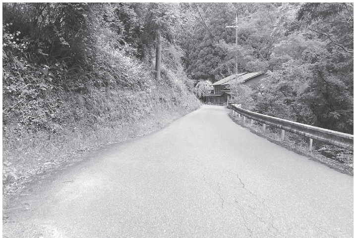
山側への拡幅が予定されている

奈良県吉野土木事務所は、主要地方道洞川下市線「才谷工区」の整備を進めている。同工区は、県南部山間地域の天川村、黒滝村、下市町を連絡し地域間交流を支援する道路である主要地方道洞川下市線の下市町才谷を通る区間で、民家の間を縫うように走る箇所が多く、道路幅員が狭小で、すれ違いも困難な道路。