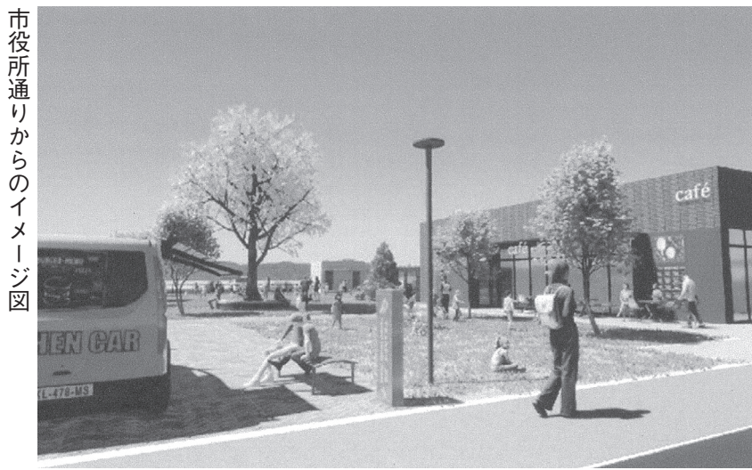
市役所通りからのイメージ図

すると想定されている。このことから、跡地は将来的な公共施設の集約化が行われるまでの期間において、暫定的に旧庁舎跡地を有効利用することとした。事業の対象となる旧庁舎跡地は大字中17番地1、19番地1、19番地10、100番地1、