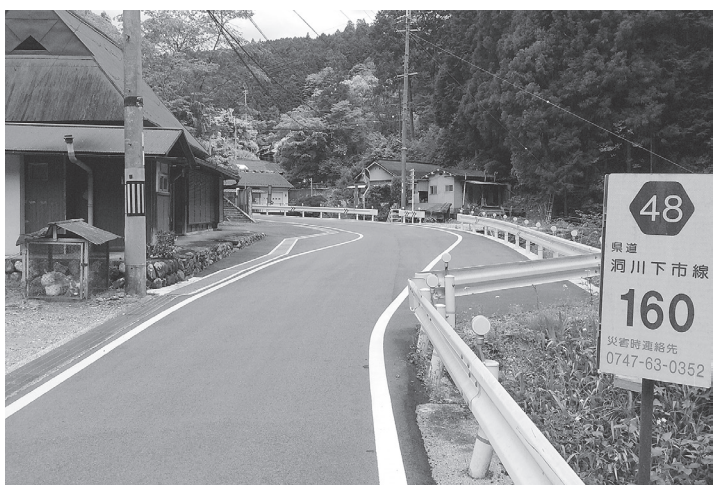
3年3月に部分供用された区間

令和元年10月から道路拡幅工事に着手し、令和3年3月末には、全体計画延長6200mのうち、才谷集落内の延長62m(道路幅員を3.0mから5.0mへ拡幅)と集落の南側