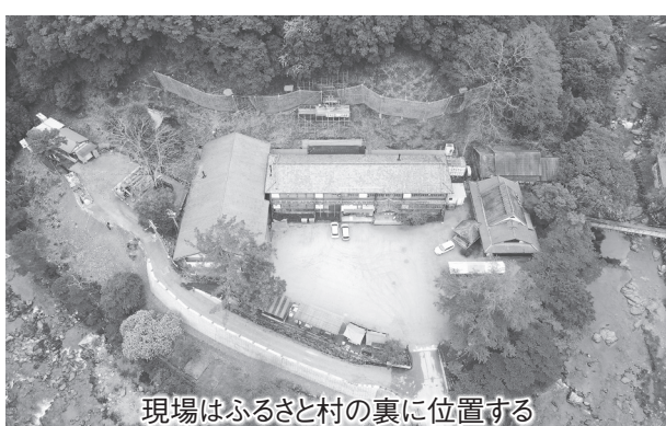
現場はふるさと村の裏に位置する