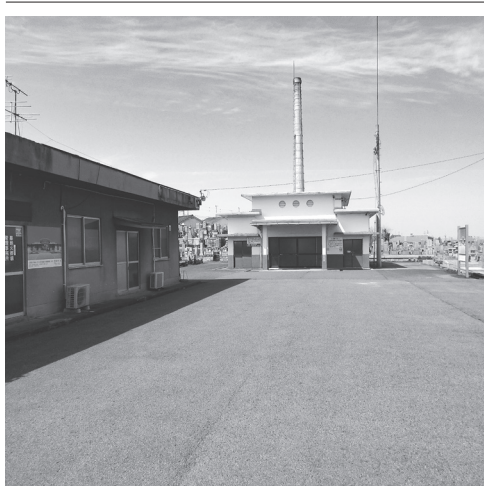
現在の御所市営墓地