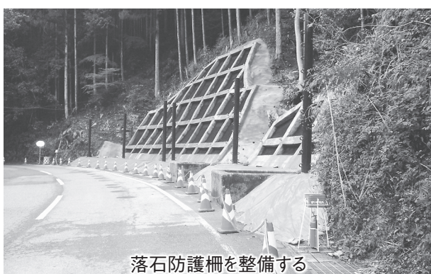
落石防護柵を整備する

4月27日時点では、足場を組んでいた、続いて落石防護柵等を整備する。現場付近は、交通量は少ないが他の工事現場が点在している事もあり、ダンプの往来が多くなっている。その為、歩行者などの安全を確保しながら工事を進めている。設計は、トニチコンサルタント。工事延長128メートル、法面工(法面工)477平方メートル、鉄筋挿入工45本、落石防護柵工96メートルの規模。令和3年10月14日、令和4年6月30日の工期を予定する。