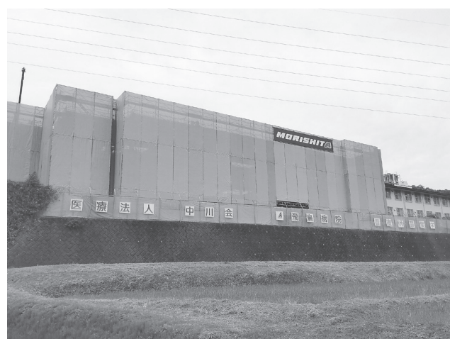
新病棟には完成後、189の病床が入る

新病棟は将来「認知症治療病棟」の設備基準をクリアする予定で、救急患者の受入や合併症患者の受入をしている「一般病棟」、退院支援を目指す「療養病棟」に加えて「認知症治療病棟」を開設計画を進めており、病床再編によって幅広いニーズに応えられるような受入体制の構築を目指している。