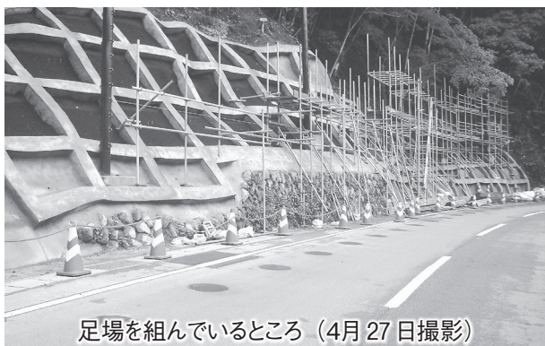
足場を組んでいるところ(4月27日撮影)

宇陀土木事務所は、一般県道大又小川線において道路を守る工事「一般県道大又小川線小工区法面工事(土砂災害対策道路事業(地方道災害防除)1-B220-5土)