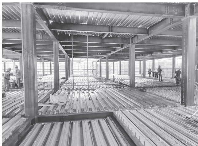
鉄骨建方が完了、コンクリート打設の準備に掛かっている

飛鳥病院は昭和59年、高市郡高取町与楽1160番地に開設、精神科、神経科、内科、放射線科の4科(388床)を持つ医療機関として地域に根ざってきた。