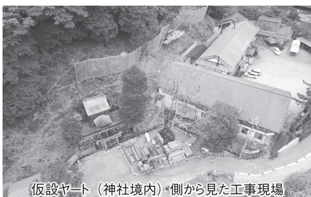
仮設ヤード(神社境内)側から見た工事現場

4月27日時点では、足場を組んでいた、続いて落石防護柵等を整備する。現場付近は、交通量は少ないが他の工事現場が点在している事もあり、ダンプの往来が多くなっている。その為、歩行者などの安全を確保しながら工事を進めている。設計は、トニチコンサルタント。工事延長128メートル、法面工(法面工)477平方メートル、鉄筋挿入工45本、落石防護柵工96メートルの規模。令和3年10月14日、令和4年6月30日の工期を予定する。