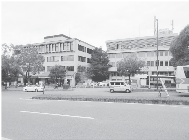
奈良商工会議所会館(右)と奈良県中小企業会館の現況