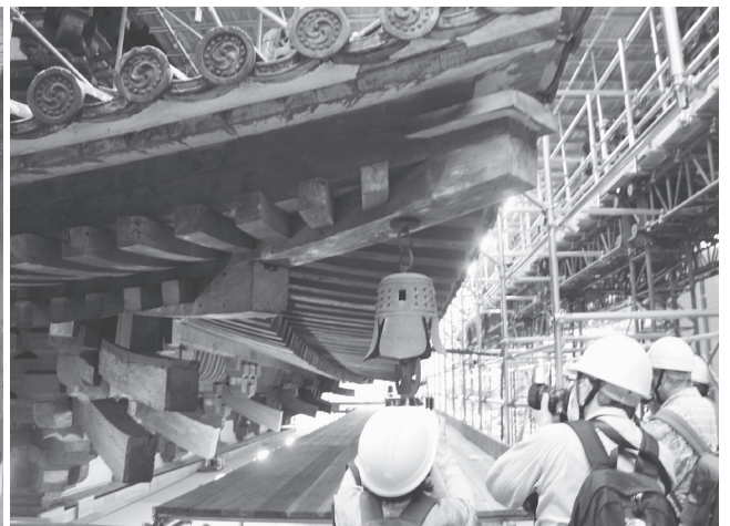
垂木、組み物などの構造物を間近に見ることが出来た