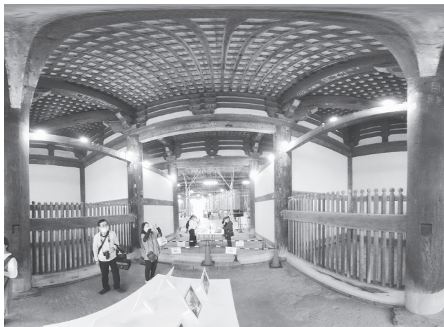
1階の主要部材は痛みが少ない