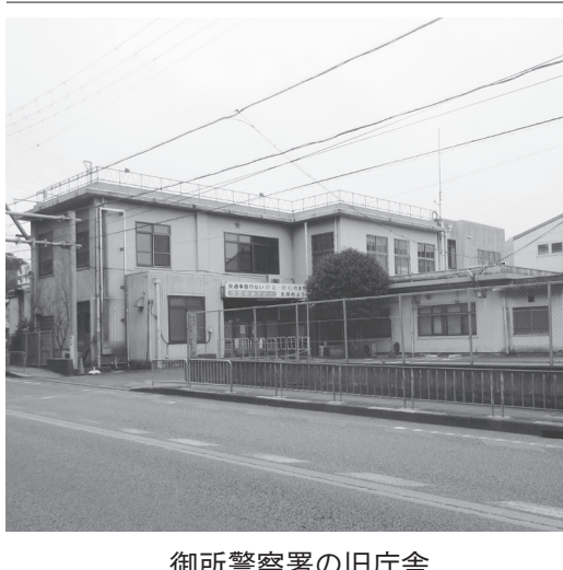
御所警察署の旧庁舎

奈良県警察本部は、次の2件に総合評価落札方式一般競争入札を適用して4月26日に公告した。入札参加申込書を5月16日まで、技術提案書を5月25日まで、入札書及び業務委託費内訳書を6月15日、21日に受け付けて6月22日に開札する。ともに建築士法の規定による一級建築士事務所登録を行っていること。県建設工事等競争 入札参加資格のうち建築設計業務に登録していること。 【高田警察署御所警察庁舎改築工事設計委託第04-10-設号】 近畿圏(奈良県、滋賀県、京都府、大阪府、兵庫県、和歌山県、福井県)に本店または営業所(県に対する競争入札参加資格を有するものに限る)を有すること。平成24年4月1日以降に国・都道府県・