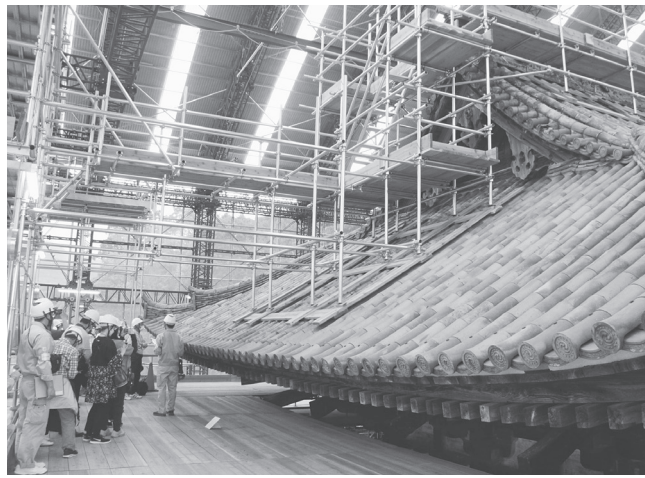
係員の解説を受ける見学者たち

仁王門は、正平3年(1348)の高師直軍により罹災後の康正2年(1456)、もしくは元弘3年(1333)の鎌倉幕府軍の攻撃による罹災後の延元3年(1339)頃に建立されたとされる境内最古の建造物。木造重層入母屋造り、本瓦葺、三間一戸の二重門で、棟高20・23メートル、軒高(初重)7・03メートル、13・105メートル。