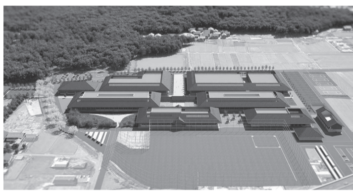
整備イメージ(奈良県立医科大学新キャンパス整備基本計画書より)

新キャンパス(橿原市四條町88)旧奈良県農業研究開発センター、周辺の用地を取得して敷地面積約12万8000平方メートル。東京ドーム約2.7個分に、教育・研究部門を全面移転する計画を進めている。桜川以西の敷地A約9万3500平方メートル、敷地B約3500平方メートル、敷地C約9500平方メートル、敷地D約3000平方メートル。南側のアクセス道路は橿原市が東側を整備済。 2期に分けて整備することとし、敷地北側に配置する看護学科・医学科「教養部門」を先行させ、講義棟や実習棟など主要4棟を6年度中に完成させる方向性を固めている。建設工期として4年度、6年度を見込んでいる。継続整備となるのは研究棟1と2、総合研究棟、交流施設、事務局棟、エネルギーセンター、外構。先行整備部分の建築工事は今年度内に着工し、6年度中に竣工するスケジュール。 施設内容は▽実習・研究棟RC造3階建延べ面積約8780平方メートル、講義棟RC造3階建延べ面積約8430平方メートル▽講義・図書棟RC造3階建延べ面積約5240平方メートル▽体育館・クラブ棟S造2階建延べ面積約2630平方メートル、武道館S造2階建延べ面積約740平方メートル。造成工事は大日本土木・ピーエス三菱・森下組JVの施工で順調に進められている。(吹上)