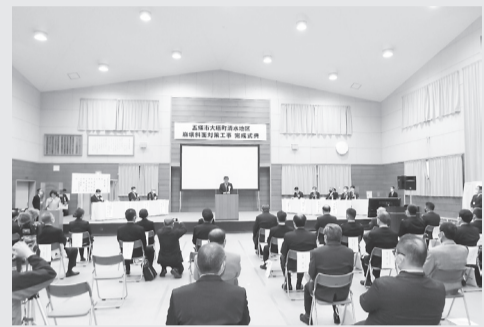
関係者約50人が出席した完成式典(16日、大塔体育館)

平成23年9月の紀伊半島大水害で大規模な深層崩壊が発生した五條市大塔町清水地区で、崩壊斜面对策工事の完了に伴う式典が16日、現場近くの大塔体育館で開かれた。主催者側から国土交通省水管理・国土保全局の三上幸三砂防部長、東川直正近畿地方整備局長、荒井正吾奈良県知事、太田好紀五條市長らが出席、来賓として田野瀬太道衆議院議員、堀井巖参院議員、秋本登志副県会議員、山口耕司五條市会議長ほか、消防、警察、地元関係者ら約50人が出席。冒頭に黙とうをささげた。その後、記念看板の除幕や慰霊碑前で献花式などが行われた。