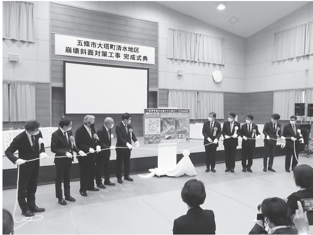
記念看板のお披露目

県と連携して市民の安心安全を守りたい。また、次世代に伝えたい」とそれぞれ挨拶。 田野瀬代議士は「多面的なお役に立ち、安心安全な地域づくりに勤しみたい」。堀井議院は「次の世代に安心な形で引き継がれるよう努力したい」。秋本県議は「安心安全なまちづくりを進める」と萩田義雄県会議長の祝辞を代読。山口議長は「地域住民の生活の安全に大きく寄与するもの」とそれぞれ祝辞を述べた。