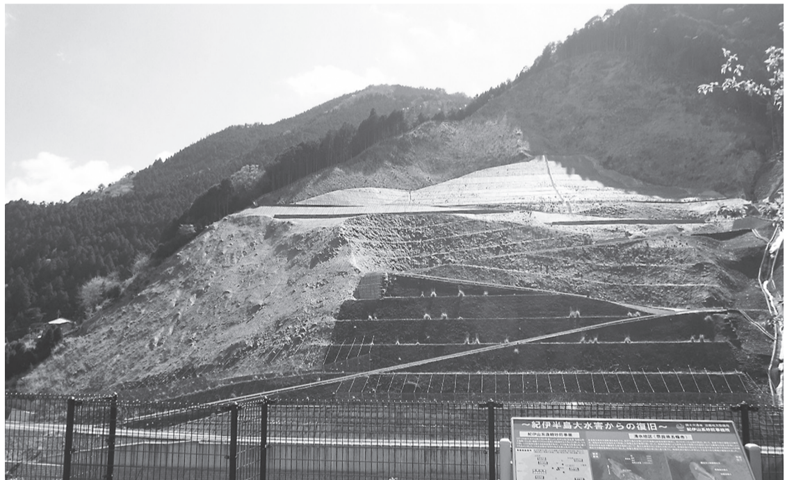
対策工事が完了した清水地区

奈良県五條市の清水地区は、平成23年9月の台風12号(紀伊半島大水害)により、斜面が崩壊し、約160万㎡の土砂が流出した。斜面再崩壊による崩壊土砂や、熊野川河道部における顕著な河床上昇等により、斜面对岸の宇井地区、隣接する清水地区で甚大な被害が生じる恐れがあり、崩壊斜面の安定化や洪水流の安全な流下を目的に、斜面抑止工や護岸整備等を行った。