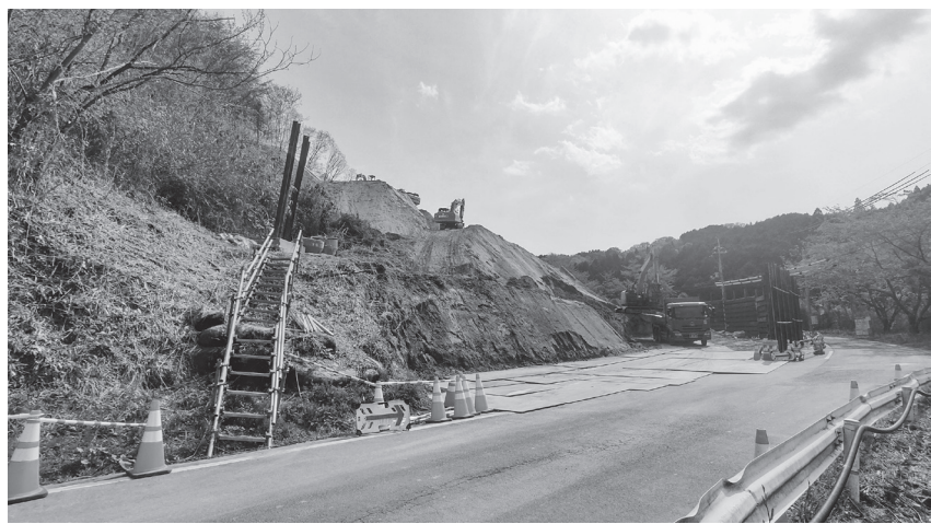
拡幅が急がれている大保道路 (撮影: 4月19日)

奈良土木 奈良県奈良土木事務所が進めている「一般国道369号大保道路」整備工事は現在、拡幅のための切土工事を推進している。 国道369号は、奈良市を起点とし、三重県松阪市に至る延長約12.8キロメートル(奈良県域約8.6キロメートル)の幹線道路で、県東部地域の各市村を繋ぐ唯一の幹線道路であり、全線が緊急輸送道路に指定されている。 大保道路は、平成27年に事業採択され、同