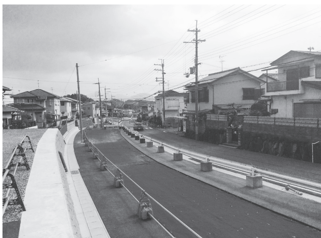
早期供用目指す樅井～三室工区

び三郷町を南北に縦断する延長約950メートルの区間。幅員が狭く線形が悪いため、交通事故が多発している。また、住宅地の中を抜けており、通学路でもあるため児童などの歩行者の利用も多いが、歩道が設置されておらず、人対車両の事故も多発している。 同土木事務所ではこのような当該路線の状況から、現道を14.0メートルに拡幅、2車線の車道と歩道の整備する計画。現在、工区全体の8割程度まで拡幅工事を完了しており、今年度以降に歩道や側溝などの整備を進めてゆく