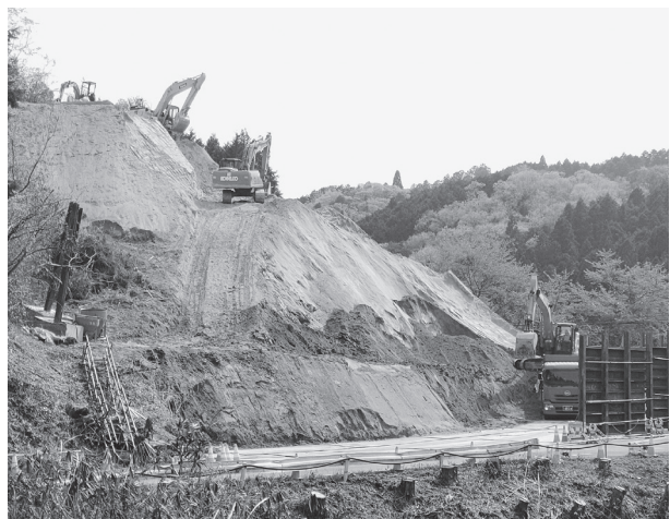
現在切り土工が推進されている

奈良土木 奈良県奈良土木事務所が進めている「一般国道369号大保道路」整備工事は現在、拡幅のための切土工事を推進している。 国道369号は、奈良市を起点とし、三重県松阪市に至る延長約12.8キロメートル(奈良県域約8.6キロメートル)の幹線道路で、県東部地域の各市村を繋ぐ唯一の幹線道路であり、全線が緊急輸送道路に指定されている。 大保道路は、平成27年に事業採択され、同