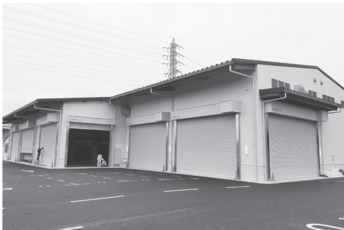
現在、竣工に向け検査などが行われている

上 牧 町 上牧町が整備を推進している不燃ごみ等中継施設建設工事は、4月末に竣工する予定。同施設はゴミ処理の広域化に伴い、天理市内で山辺・県北西部広域環境衛生組合が建設 計画を進めている新ゴミ処理施設に集約する事を見越し、中継施設を整備する。 建設地は、北葛城郡上牧町大字上牧1719-1外で、設計をグリーンコンサルタント、施工を村本建設で令和3年6月に着工した。 工事概要は、鉄骨造平屋建、敷地面積3390.26平方メートル、建築面積1506.29平方メートル、延床面積1,431.84平方メートル。 現在、上牧町では香芝市にある上牧町塵芥焼却場が平成28年度に停止したことに伴い、焼却場内で行われていた不燃物の処理は三重県の民間業者に委託しており、不燃ごみの中