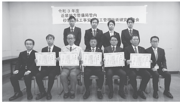
記念撮影 (3月14日、近畿地方整備局第1別館)

近年、要望額に対する国費の措置率が低下傾向にあり、その影響で本事業全体の進捗が遅れが発生している。プール施設に関しては、昨年度からパシフィックコンサルタンツ