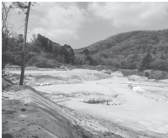
造成が進むプール施設予定地

また、公園施設へのアクセスルートとなる都市計画道路「尼寺関屋線」も一体として整備を進め、プールがオープンする6年夏までに整備を進める意向だ。