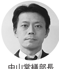
中山 營 繕 部 長