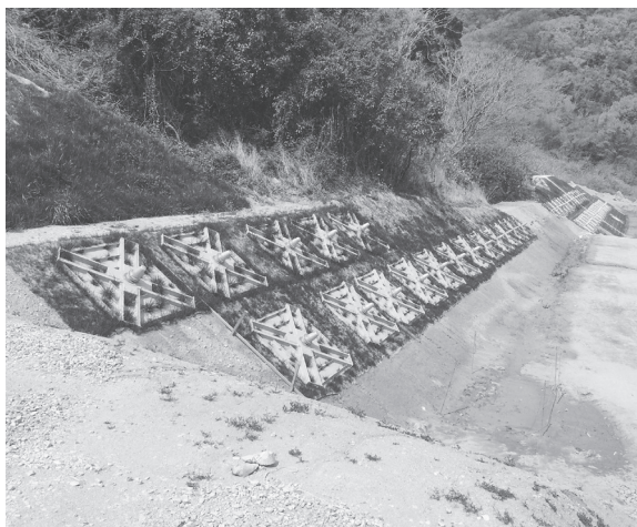
完成したアンカー工、引き続きこの下部にアンカー工が施工される

事(防災・安全交付金事業(砂防))第21-2-3号を藤本建設・奈良県緑化土木JVの倉寺町地内、工事延長95m、主堰堤1基、付帯保護工3基。工期は7月末を予定する。施工を進めている。現在、堰堤はほぼ完成し付帯工事を行っている。施工場所は生駒市小