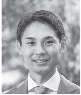
天理市長 並河 健

朝和幼稚園(天理市成願寺町386)園舎耐震補強工事は、敷地面積5091・294平方メートル(保育室2棟(352平方メートル)の園舎耐震補強工事に伴い、外壁材に含有されていた石綿を除去し、耐震補強、保育室内装リニューアール、幼児トイレの乾式・様式化を行った。また、内装リニューアールに伴い、照明器具のLED化、手洗いの自動水栓化、空調機器設置工事を行ったもの。 骨耐震補強、既設屋根ケレン清掃後屋根専用仕上塗料塗布、内装仕上(壁・床・天井)、幼児トイレ用乾式化及び洋式化、手洗い自動水栓化、照明LED化、