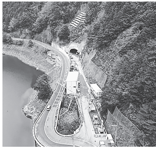
工事が進む阪本トンネル南坑口

補助対象工事は▽補助対象空き家等を含む一筆の土地に存する建築物(基礎を含む)を全て除去する工事▽建築業法第3条の規定による建築業の許可を受けた者(土木工事業、建築工事業または解体工事業の許可に限る)、建設工事に係る資材の再資源化等に関する法律第21条の規定による解体工事業者の登録を受けた者のいずれか。補助金は、補助対象経費の額に5分の4を乗じて得た額、国土交通大臣が定める標準除却費に延べ床面積を乗じて得た額に5分の4を乗じて得た額または50万円のいずれか少ない額。