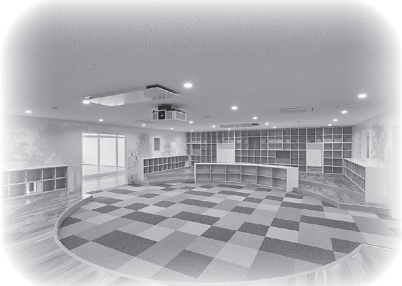
メディアセンター (1階)