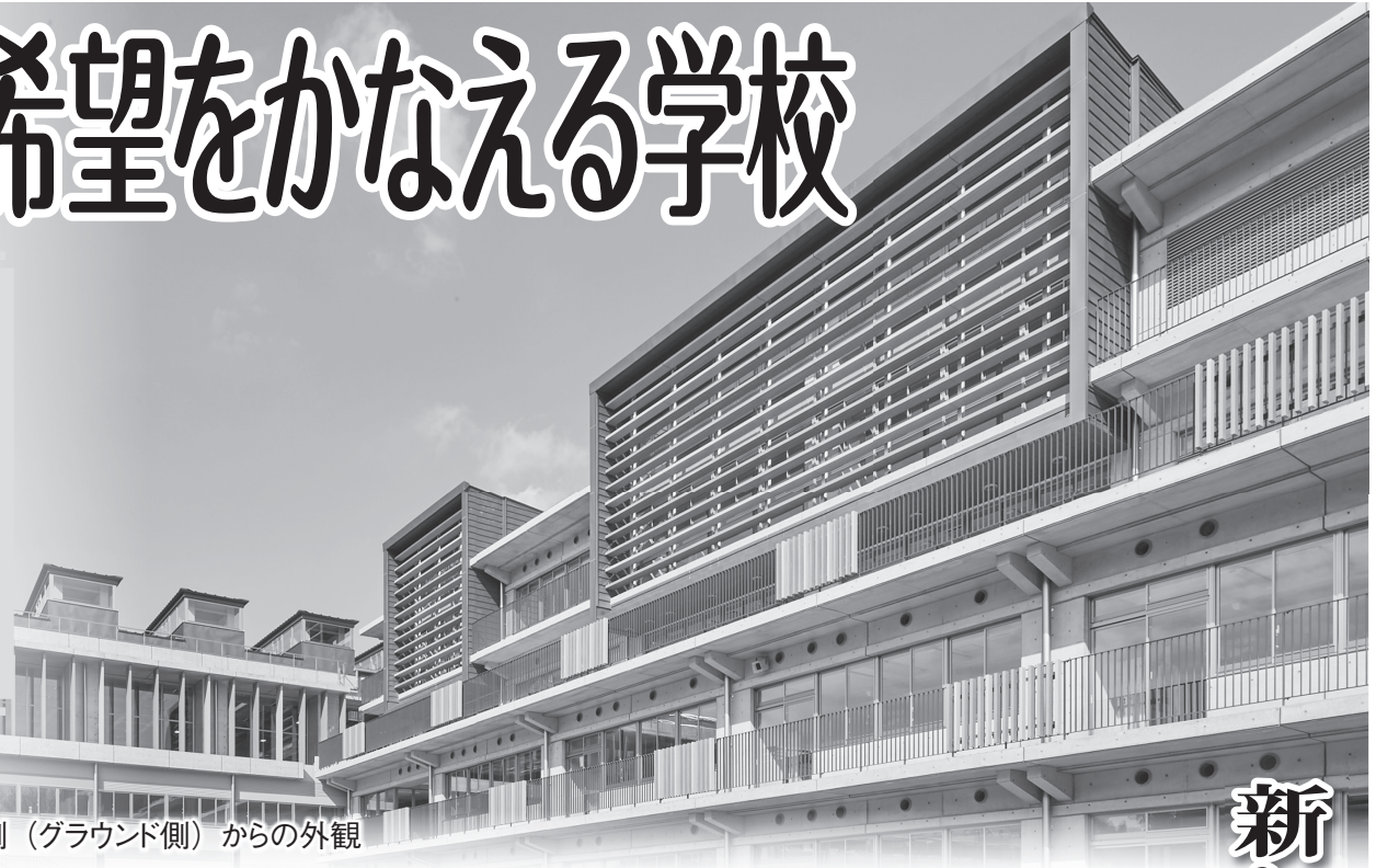
南側（グラウンド側）からの外観

王寺町は、令和2年8月から整備を進めていた「【仮称】王寺義務教育学校（北）」(王寺町本町)がこのほど完成。人口減少・少子高齢化をはじめ、グローバル化の進展など、社会全体が大きく変化中、6・3制の区切りに捉われない9年間を通した一貫性のある義務教育校を新設し、次代を担う子供たちが心豊かに力強く未来を切り開いていく学び舎づくりを目指している。