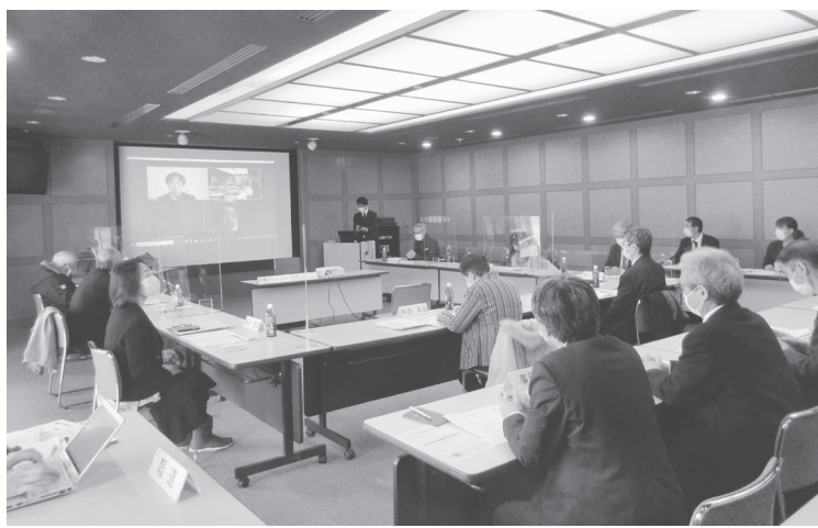
整備基本計画について審議した

今年度内に「飛鳥宮跡保存活用計画」の承認を受ける見通しで、整備基本計画策定の段階にステップアップしている。今年7月にはパブリックコメントを実施、10月にも整備基本計画を策定する予定。令和4年度末から5年度にかけて基本設計、6年度には実施設計(建築・施設)を行って7年度に整備工事に着手するスケジュール。担当は総務管理係(電話0742-277517)。