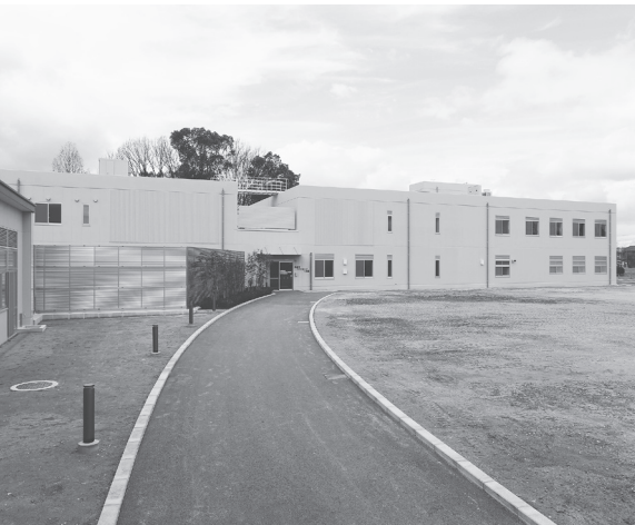
児童相談所などを設置する1号館(西棟)

完成した「奈良市子どもセンター」は、敷地面積9912・21平方メートルに中央に緑地を配置し東西2棟(建築面積2144・21平方メートル・延床面積3679・12平方メートル)の規模。市内すべての子ども達に今を幸せに生き、将来に夢と希望を持つて成長できるまちを目指し制定された「奈良市子どもにやさしいまちづくり条例」や「奈良市子どもにやさしいまちづくりプラン」を具現化したもので、1号館(西棟、S造2階建)には、児童相談所、子ども・家庭総合支援拠点、子ども発達支援等を整備。2号館(東棟、S造2階建)には、地域子育て支援センター・キッズスペース(にじいろ)、発達支援親子教室を整備した。赤ちゃん訪問や助産制度・ショートステイ事業等、様々な子育て