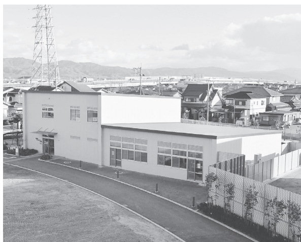
キッズスペースなどを設置する2号館(東棟)

連携を強化 中核市が児童相談所を設置するメリットを最大限に活用し、妊娠前から子どもへ家庭への切れ目のない支援を促進するなど、子育ての不安や悩みに継続的に対応する施設として、地域の子育て世代や家族から大きな期待が寄せられている。市では、新型コロナウイルス感染症の状況を見ながら3月末に竣工式典を予定する。設計は大建設、監理は総合企画設計、施工は村本・三和特定建設工事共同企業体それぞれ担当した。