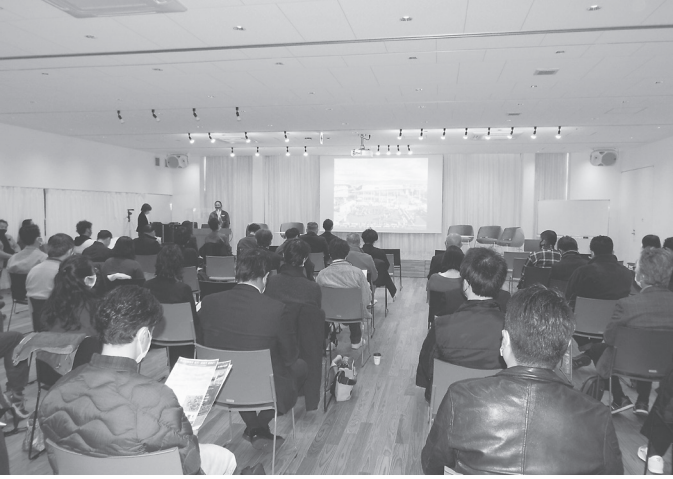
講演会の様子 (昨年12月25日、Mii Moホール)