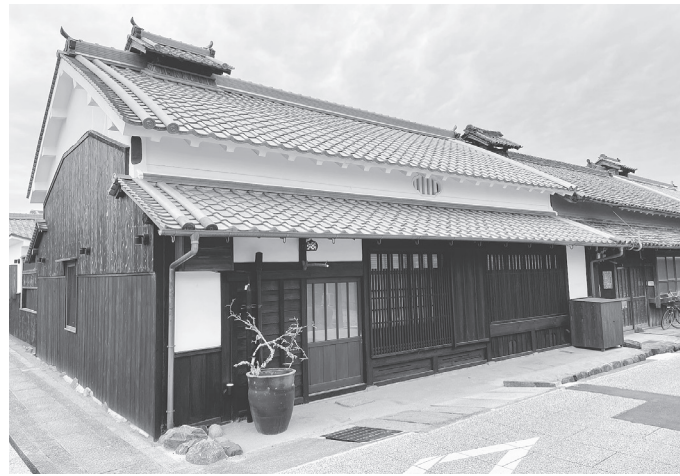
旧大鳥家住宅の主屋=明日香村飛鳥

耐災害性の強化▽環境省▽河川・ダム、道路、都市公園、鉄道、空港、港湾・漁港、ため池、農業水利施設、学校施設等の重要インフラに係る老朽化対策▽文部科学省、農林水産省、国土交通省▽3次元モデル、カメラ画像等を活用したインフラの整備、管理などデジタル化の推進▽国土交通省▽安定した地殻変動監視のための電子基準点網の耐災害性の強化▽国土交通省▽線状降水帯、台風等による大雨等の予測精度向上等の防災気象情報の高高度化対策▽国土交通省▽盛土による災害の防止▽ 農林水産省、国土交通省、環境省▽条件不利地域における地方活性化(豪雪地帯)▽国土交通省など。 自然災害からの復旧・復興の加速として▽公営住宅の災害復旧▽国土交通省▽河川、道路、鉄道等の災害復旧▽国土交通省▽農林