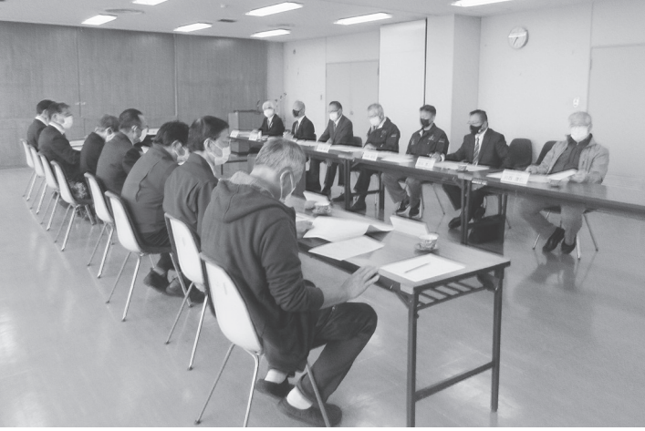
基本方針見直しを了承した運営協議会

奈良県は、中央卸売市場再整備について、これまでの市場エリアを先行する段階的整備から、市場エリアと賑わいエリアを一体的に整備する見直しを行い、12月に県議会に報告して基本方針を策定、市場事業者と基本協定を締結したうえで実施プランを改訂する。令和4年度から事業者の公募、基本・実施設計が行われる見通し。