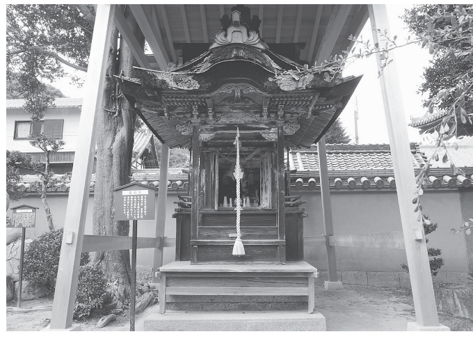
中之坊稲荷社=葛城市當麻

文化審議会(佐藤信会長)は、19日に同審議会文化財分科会の審議を経て、新たに91件の建造物について、文部科学大臣に答申した。この結果、登録有形文化財は78カ所300件になる。 中之坊稲荷社は當麻寺中之坊の境内北西隅に建つ鎮守社。江戸末期に建てられた木造平屋建、檜皮葺、建築面積1・4平方メートル、正面に千鳥破風、向拝を唐破風とする。軸部全体に彩色を施すほか、細部彫刻、組物廻り、屋根の形式など装飾性に富む。 旧大鳥家住宅主屋は