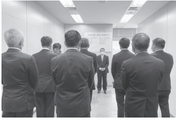
建築、建築設備を表彰

営繕プロジェクト推進室 中尾・米杉JV、尾田・大倭JV、藤原・和田JV、博電・開発JVが受賞