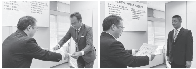
和田エンジニアリング