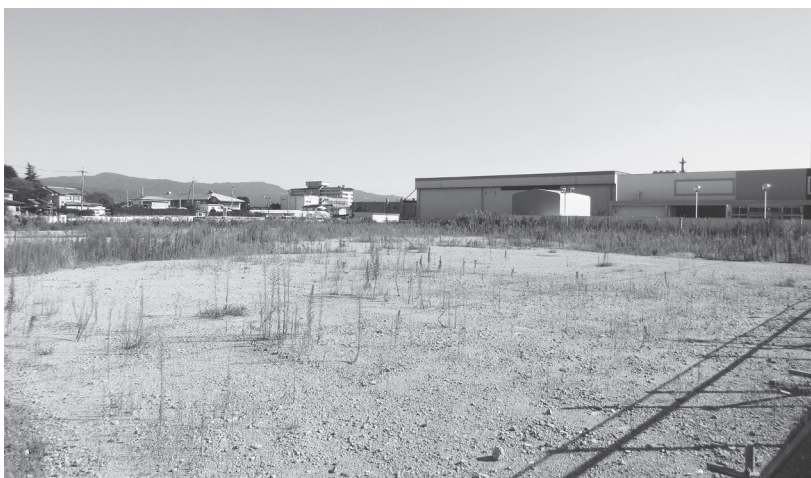
国道24号沿いの出店予定地

奈良県産業・観光・雇用振興部は、モンベルホールディングス(堺市北区百舌鳥赤畑町1丁41番地6)から(仮称)モンベル奈良市八条町計画)に係る大規模小売店舗立地法第五條第一項の規定による大規模小売店舗新設の届出を9月27日に受けたことから、4年2月15日まで産業振興総合センター及び奈良市観光経済部産業政策課で届出と添付書類を縦覧に供するとともに、産業振興総合センターで意見を受け付けている。 同店は、奈良市八条町369番1ほか5筆の敷地面積6382.53平方メートルに計画。国道24号に面した東側で、沿道には商業施設が集積している地区。4年5月28日に新設予定