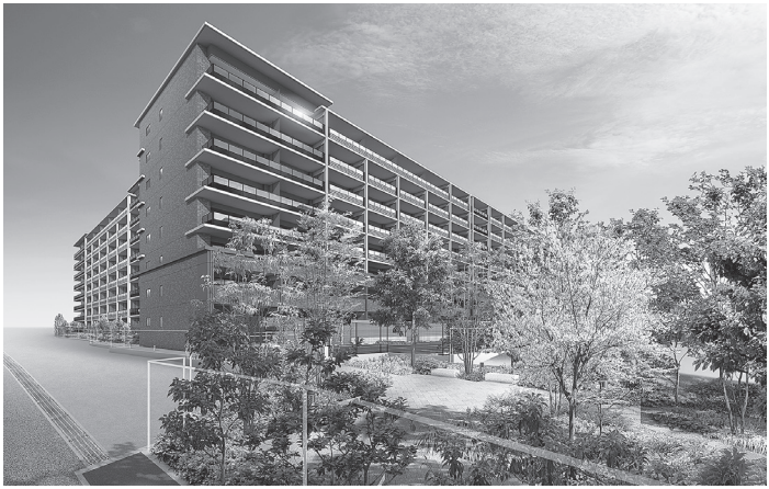
「ルネ富雄」マンション (完成イメージ図)