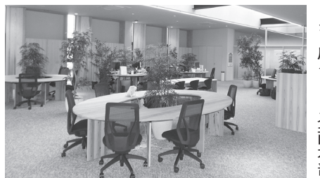
ガラスパーテーションで仕切られ、広々とした企画本部