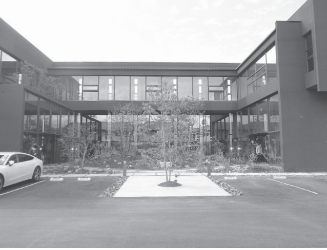
自然を五感で感じる開放的な記念館＝大和高田市曾大根

研修センターは、大研修室・中研修室(2室)・Web研修室を備え、最大200席(可変型パーテーション)の使用が可能。オンラインセミナーや各種研