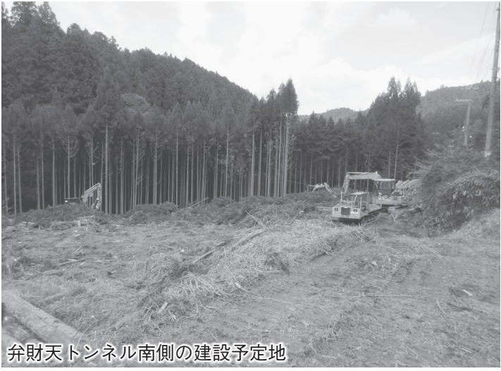
弁財天トンネル南側の建設予定地

指名競争入札「第03-C037号ジビエ利用プロジェクト事業 獣肉処理加工施設建設用地造成設計業務」を 参加12者(1者辞退) で9月16日に開札(入札情報は9月28日⑤面掲載)、サンコーコンサルタント奈良営業所業務を委託した。