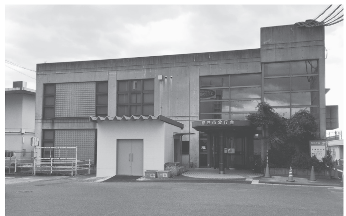
改修が行われる分庁舎(写真)と西分庁舎

桜井市は10月1日、今年度の公共工事の発注見通しを公表した。9月3日開札、全者辞退の為入札取止めになった「桜井市分庁舎改修工事」は、第3四半期(6ヶ月)に発注される。同改修工事は、分庁舎RC造2階建て、西分庁舎S造平屋建て、内外部の改修、撤去、外構整備や電気設備、機械設備などの整備。設計は、礎建築事務所が担当。新庁舎は先月21日、開庁した。旧庁舎の西側隣接地に建設した新庁舎は、鉄骨造4階建て、延床面積7800平方。内装には地元産のSG材をふんだんに使用した温かみのある造りとなっている。旧庁舎は、今月から解体が行われ、跡地には駐車場や地域交流広場(11月1日開札)を整備する予定。