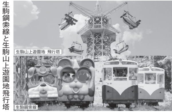
生駒鋼索線と生駒山上遊園地飛行塔

土木学会(谷口博昭会長)はこのほど、令和3年度選奨土木遺産として、近畿日本鉄道「生駒鋼索線(生駒市)と生駒山上遊園地(同)