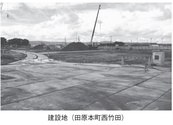
建設地 (田原本町西竹田)