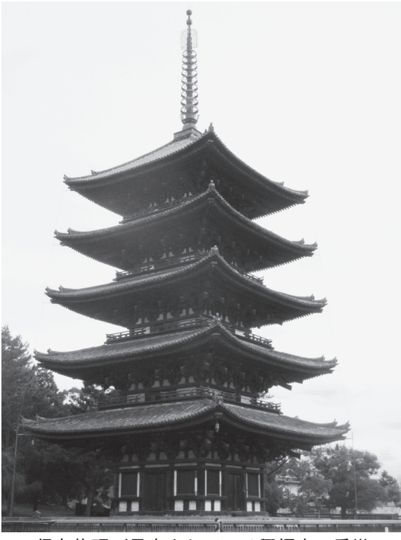
保存修理が予定されている興福寺五重塔

奈良県文化・教育・くらし創造部文化財保存事務所は、一般競争入札「国宝興福寺五重塔素屋根実施設計業務3文保委第2号」を9月1日に参加2者で開札(入札情報は9月16日⑤面掲載)、落札した柘谷設計に業務を委託した。業務は国宝興福寺五重塔素屋根建設工事の実施設計、住民