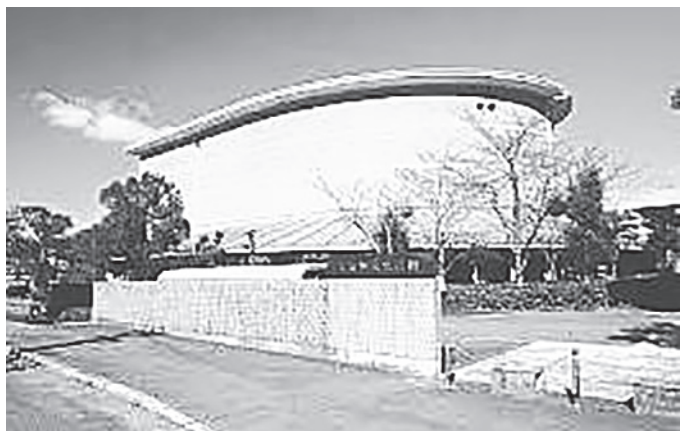
大淀町文化会館(あらかしホール)

研修室などを備えている。今回の増改築工事は、別館として木造平屋建て、建築面積134・15平方メートルの文化振興教室棟を新築する。その他、既存文化会館内(会議室、建築面積