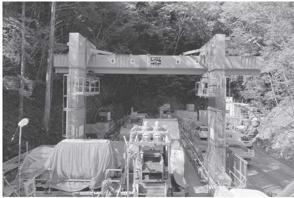
排水トンネル工（発進ヤード）

十津川村の長殿地区では、これまでに砂防堰堤1基と仮排水路や崩壊地内の土砂を除去する工事を実施。しかし現在でも湛水池を形成している。排水トンネル整備の工事では、厳しい条件下（地盤が固い、掘削距離が長い、急勾配）でも施工可能な、砂防事業としては過去例の無いCMT工法（複合推進工法）を採用して実施している。