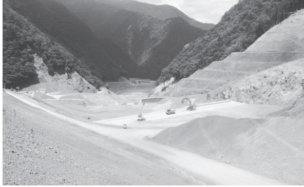
3号砂防堰堤（砂防で全国初の自動化施工）

五條市の赤谷地区では、水害により深層崩壊が発生し、その後も数十万㎡規模の再崩壊を繰り返す非常に危険な斜面直下での工事となっている。安全確保の観点から、遠隔操作により人が操作する「無人化施工」を実施してきたが、施工条件をプログラムに入力し、生成された作業手順に従い、建設機械が自動で作業を行う砂防事業では全国初の「自動化施工」を実施しており、生産性向上や省人化が期待されている。