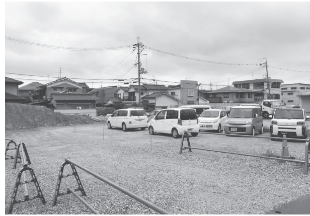
建設予定地(橿原市葛本町)

計画によると、国道24号線沿いにある同社FCオーナーのユー・ポス 建設予定地(橿原市葛本町)