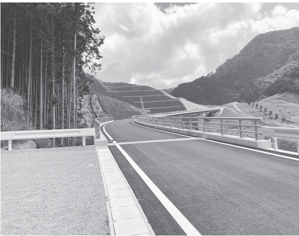
開通した市道(木守杉谷線)

田辺市の熊野地区では、砂防堰堤1基と排水路工事、湛水池の埋戻しが完了。また災害により寸断していた市道(木守杉谷線)が今年7月に開通した。引き続き床固工や法面保護等を行う。