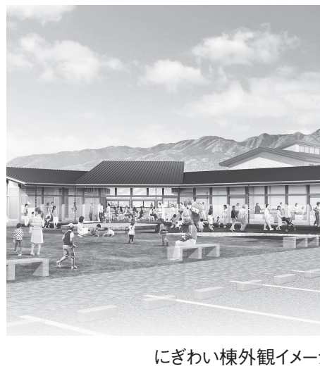
にぎわい棟外観イメージ

ことを確認・検証し、さらに点検結果を用いて橋梁台帳や橋梁点検調査の更新(橋梁点検実施)を実施する。 ▽協議用資料作成 工事請負者にて作成した関係機関等の協議用資料について、監督員の指示に従い照査等を実施する。 ▽照査 対象橋梁について、仕様書記載の設計照査を実施。