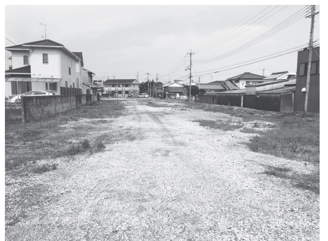
国道165号線沿い 檀原市縄手町 (建設予定地)