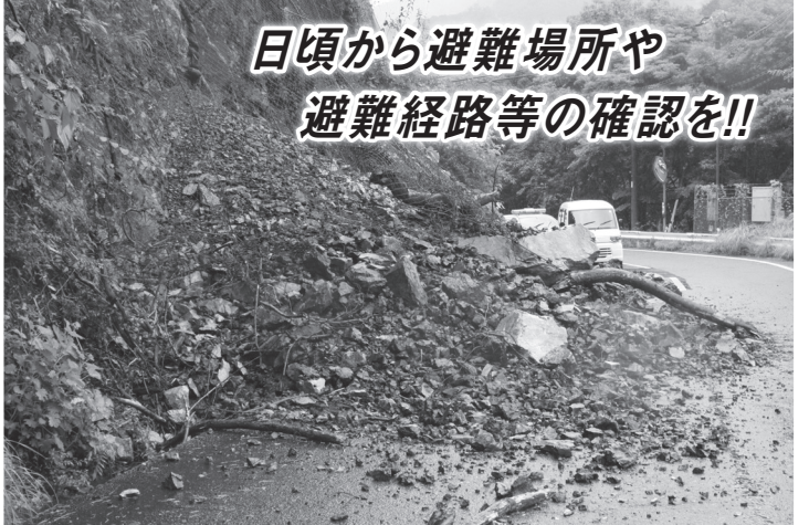
日頃から避難場所や避難経路等の確認を!!

近年、土砂災害は増加傾向にあり広域化が指摘されている。県ではメール配信サービスを有効に活用し、早めの避難を心がけるよう呼び掛けている。