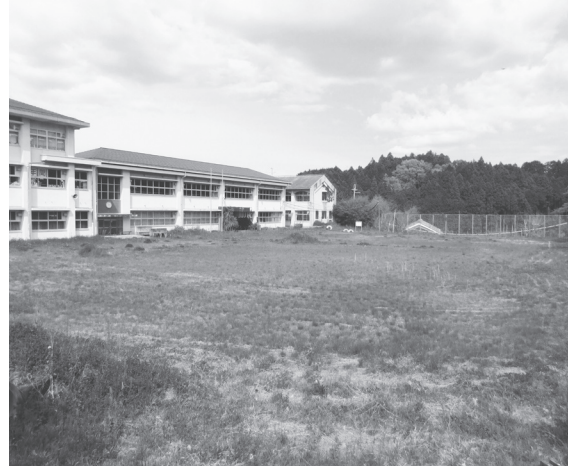
建設予定地の旧野依小学校

指名競争入札「第03-C005号宇陀市立新学校給食センター建設事業新学校給食センター設計業務」は共同設計奈良事務所が落札した。業務場所は大宇陀野依。業務は新学校給食センター設計業務1式、旧野依小学校ラン チルム改修工事設計業務1式、旧野依小学校及び関連施設解体撤去工事設計業務1式、旧野依小学校跡地現況測量業務1式。3年度から4年度にかけて基本・実施設計をまとめ、4年度に工事発注して6年度内の竣工・稼働をめざし工事を実施する。