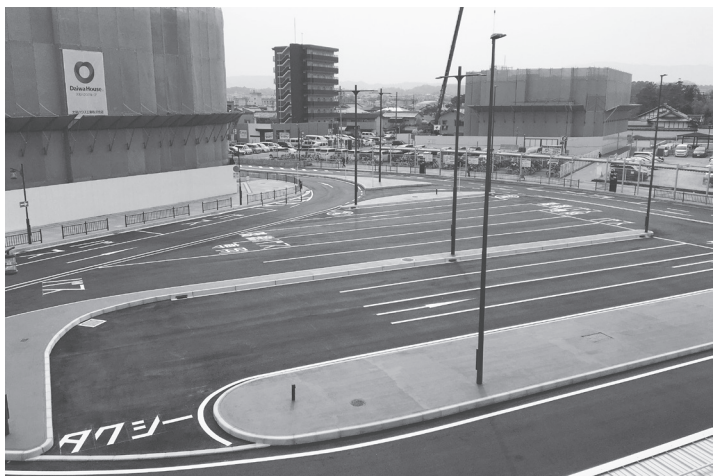
3月末に工事が完了した南口駅前広場

難な状態だったが、区画整理によって生み出された公共用地により駅前広場が整備されたことで自動車での駅へのアクセスが容易となった。駅前広場整備工事の施工は鹿島建設が担当。 この他、北口駅前広場はエスカレーターや階段周辺の整備を行い3月末から暫定使用を開始し、令和5年3月末に完成予定。駅前広場の面積は現在の1900平方メートル(暫定)から4000平方メートルとなる。(伊藤)