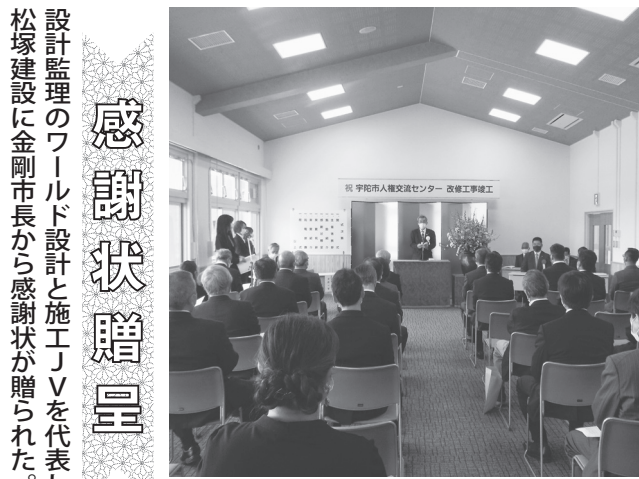
大会議室で行われた改修竣工式典