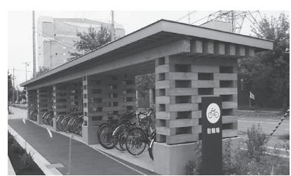
帯広第2地方合同庁舎 自転車置場 (北海道) (構造材に木材を活用)

各省各庁の営繕計画書に関する意見書制度を活用するなど、より一層の木造化、内装等の木質化の実施について働きかける。