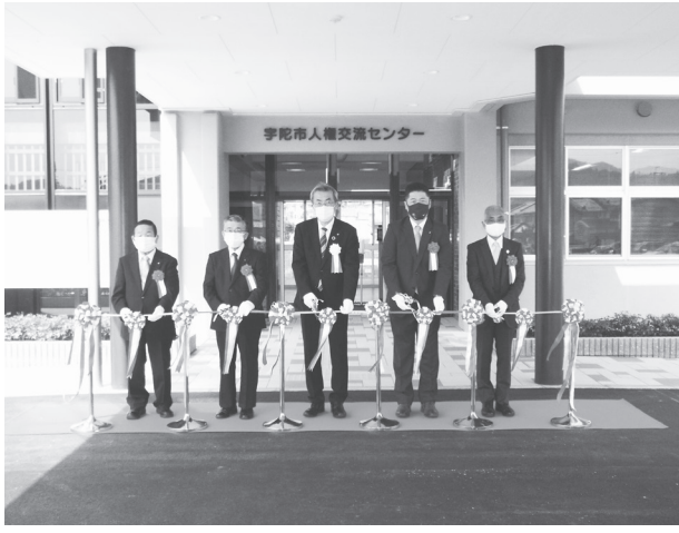
金剛市長(中央)ら関係者で待望のテープカット