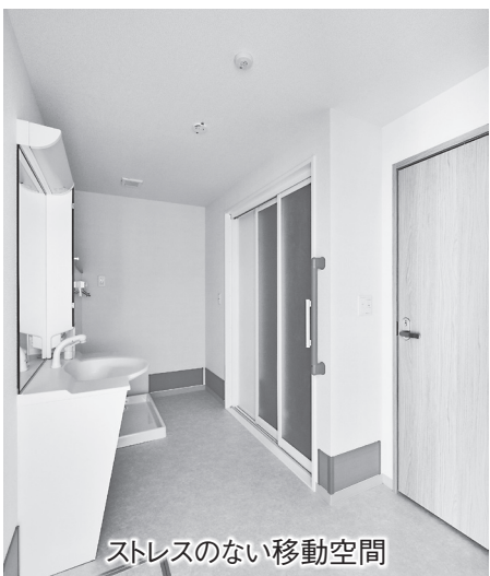
ストレスのない移動空間