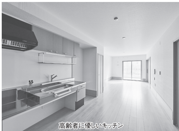
高齢者に優しいキッチン