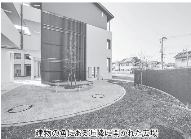
建物の角にある近隣に開かれた広場