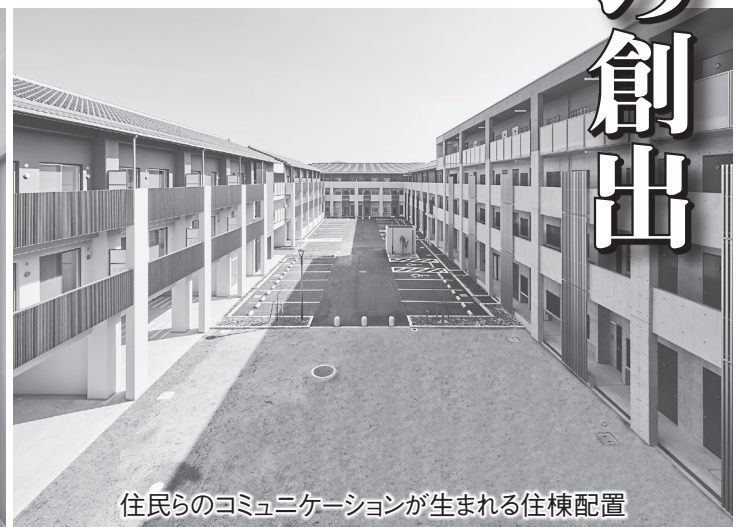
住民らのコミュニケーションが生まれる住棟配置