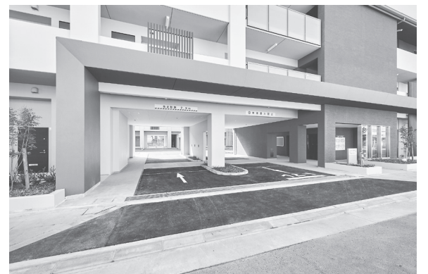
地域にとけこみ洗練されたデザイン

県営住宅桜井団地第1期新築工事(建築工事) 大日本土木・藤本建設特定建設工事共同企業体