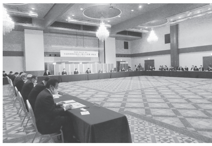
中央に覚書にサインする荒井知事

「強靱」「安全」の確保により、今後も安全・安心な水道水を将来に亘って持続的に供給する。施設共同化は▽浄水場の集約▽7年度〜30年度に段階的に市町村浄水場を廃止して統合時18カ所を7カ所にすること▽241億円の投資削減となる。連絡管の整備費50億円▽送配水施設の最適化▽市町村域を越えた送配水施設・監視制御システムの最適化を実施すること▽190億円の投資削減となる。施設共同化事業費91億円。また、7年度〜16年度に交付金39.6億円(広域化事業交付金・運営基盤強化等事業交付金19.8億円)を活用す