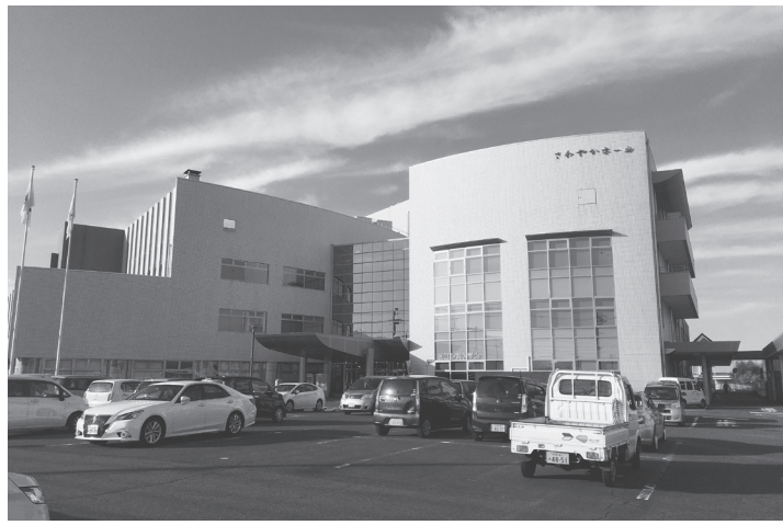
対象施設となるさわやかホール

(レストラン・ディスプレイセンター)、2階に保健センター、3階に老人福祉センター、4階に会議室が設けられている。今回のサウンディング調査では、▽イニシャルコスト削減の方策▽維持管理コストの最小化の方策▽提案内容に基づく概算費用について▽提案内容に基づ