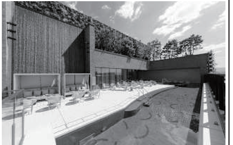
屋外温泉施設に設けられた屋上緑化及び壁面緑化

果をまとめた。屋上緑化や壁面緑化は、都市におけるヒートアイランド現象の緩和や都市の低炭素化等の観点から全国的に取り組みが進められている。 元年の全国の屋上・壁面緑化の施工実績は、最近の傾向をとらえるために全国の施工企業等にアンケート調査(造園建設会社や総合建設会社、屋上・壁面緑化関連資材メーカーなど539社に郵送によるアンケート調査、回収率は51.2%の276社)を行った結果、屋上緑化は約19.7%が施工された。この面積は、新型コロナウイルスを想定した「新しい生活様式」において、ソーシャルディスタンスとして人との距離を取る場合で、約5万6936人分に相当する。また、壁面緑化は約7.5%が創出された。これは調査を開始した平成12年から令和元年の20年間で、屋上緑化は約53.7%、壁面緑化は約10.3%が創出されたことになる。屋上緑化の単年あたりの施工面積