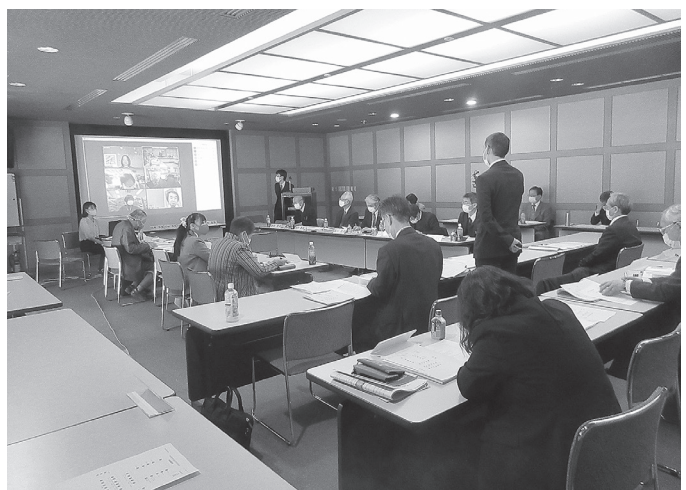
保存活用計画のとおりまとめ段階に入った

奈良県東土まねジメント部地域デザイン推進局公園緑地課は、第14回「飛鳥宮跡活用検討委員会」及び第12回「史跡及び名勝飛鳥京跡池保存整備・活用検討委員会」(ともに委員長は田辺征夫公益財団法人元興寺文化財研究所所長を兼ねた)。