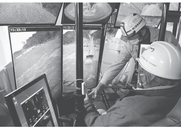
無人化施工の操作体験や山村所長から概要説明が行われた