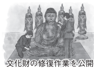
文化財の修復作業を公開