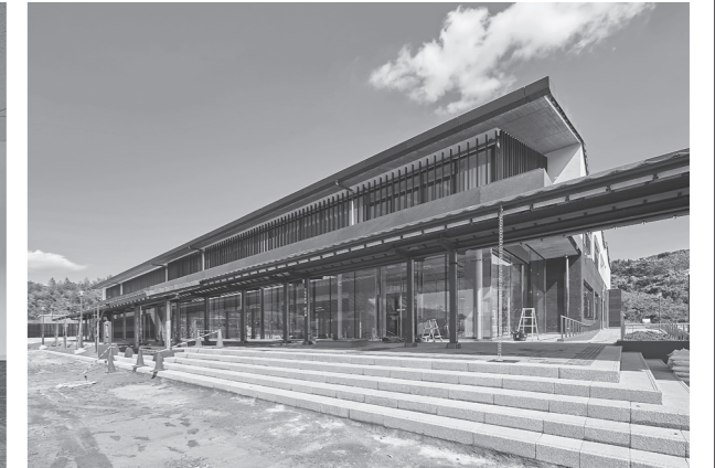
文化財修復・展示棟