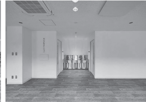
サイクルステーション（交流にぎわい棟）