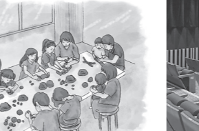
気軽に楽しめるアートなどを体験