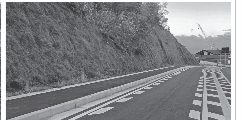
法面や擁壁の基盤整備を行った