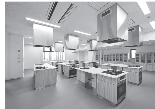
実習室（交流にぎわい棟）