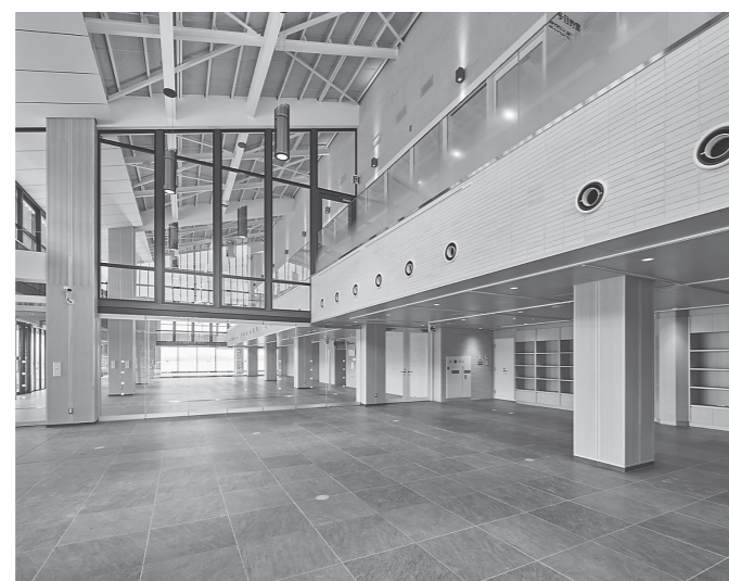
ショップ(手前)とレストラン(奥)

旬の食材を活用した料理教室や地元農産物の販売、大和平野を一望する産直レストランでは、奈良の食材を楽しむことができる、伝統工芸品の展示販売や製作・体験イベントなども行われる。