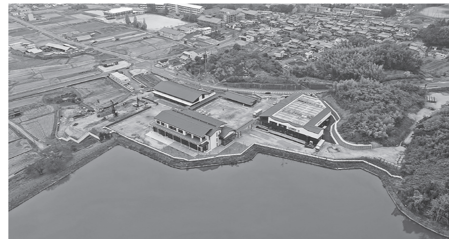
完成した施設4棟（全景）