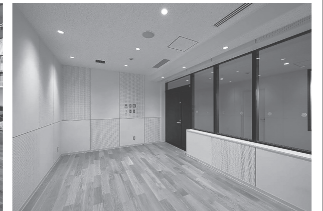
スタジオ（小）（芸術文化体験棟）