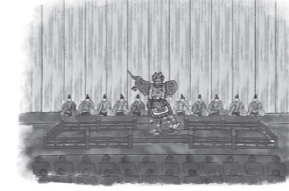
奈良に源流がある 雅楽や能楽などを鑑賞