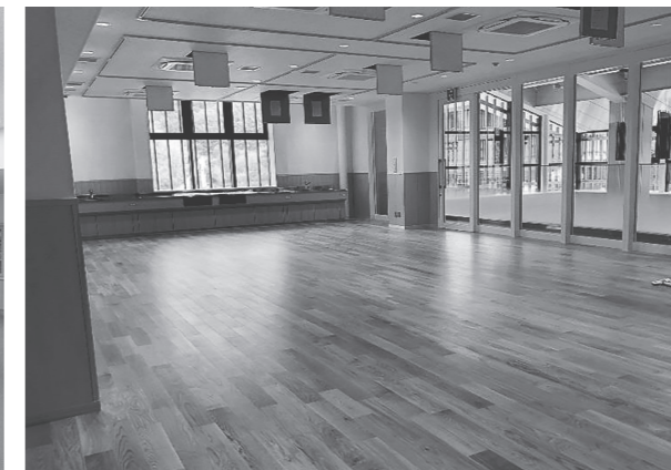
多目的室（交流にぎわい棟）